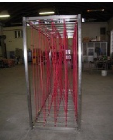
Passaggio con elastici L=2,00m x P=0,70m x H=2,10m