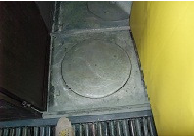
Disco rotante folle L=1,00m x P=0,70m x H=0,20m