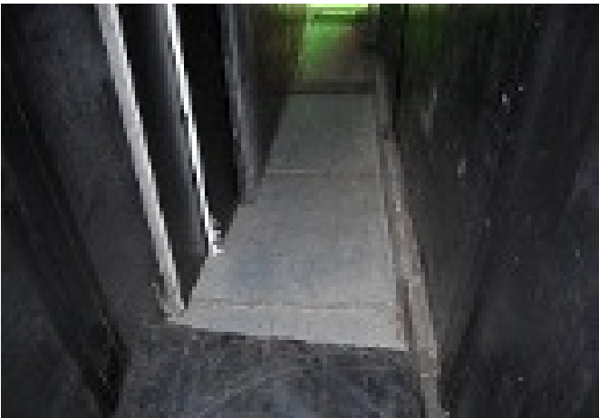
Cavallo L=3,00m x P=0,70m x H=0,45m