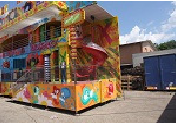
Scivolo D= 1,80m x H=4,00m con pianerottolo e materasso di arrivo con pedana incernierata