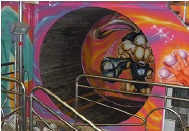
Botte motorizzata L=2,2m x P=1,70m x H=2,20m