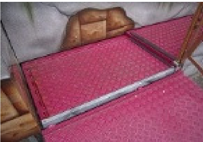
Pedana saltarina L=1,00m x P=0,70m x H=0,20m