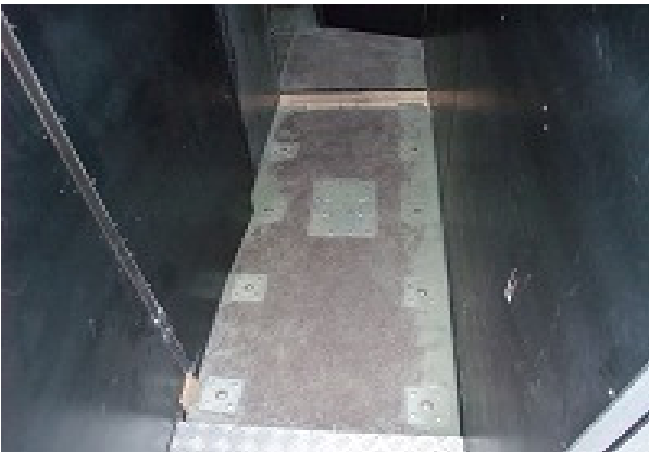
Pedana vibrante L=1,00m x P=0,70m x H=0,20m