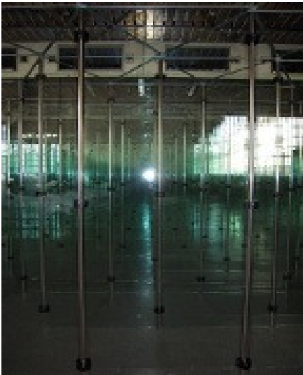
Labirinto di vetri: Colonna Vetro Specchio