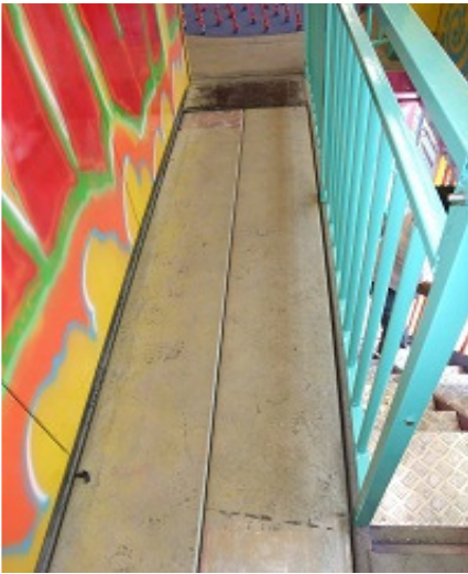
Pedana sci L=2,50m x P=0,70m x H=0,30m