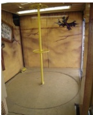
Disco rotante senza elastici D=1,6m x H=0,3m + palo inox centrale