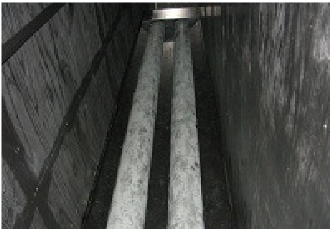
Rulli longitudinali L=3,00m x P=0,70m x H=0,22m senza motore