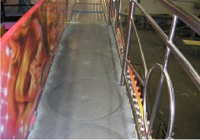
3 dischi rotanti motorizzati L=2,00m x P=0,70m x H=0,20m