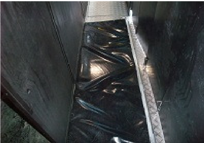
Materasso L=2,00m x P=0,70m x H=0,20m