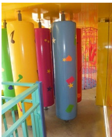
6 rulli in D=0,40 ingombro D=2,00m x H=2,2m