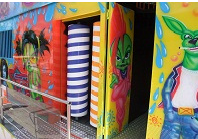
2 rulli in gomma piuma motorizzati L=1,20m x P=0,50m x H=2,30m