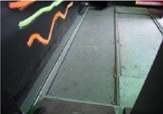
Pedana ondeggiante L=2300 x P=0,70 x H=0,25m