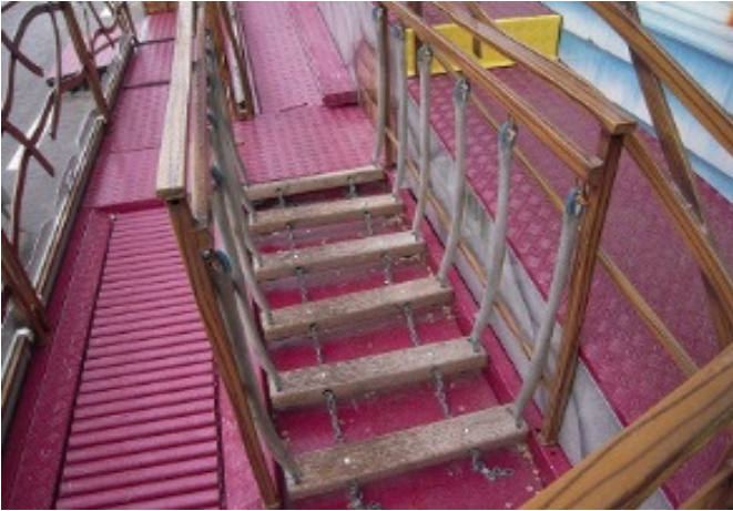
Ponte di liane incassato con corrimani L=2,00m x P=0,70m x H=1,30m