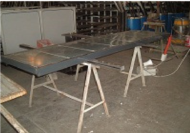
Pedana con suoni (pianoforte) L=2,50m x P=0,70m x H=0,10m