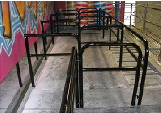
Pedana Avanti indietro con ostacoli L=4,00m x P=1,50m x H=0,45m