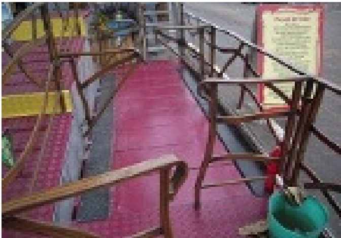
Pedana mobile trasversalmente L=2,50m x P=1,50m x H=0,20m