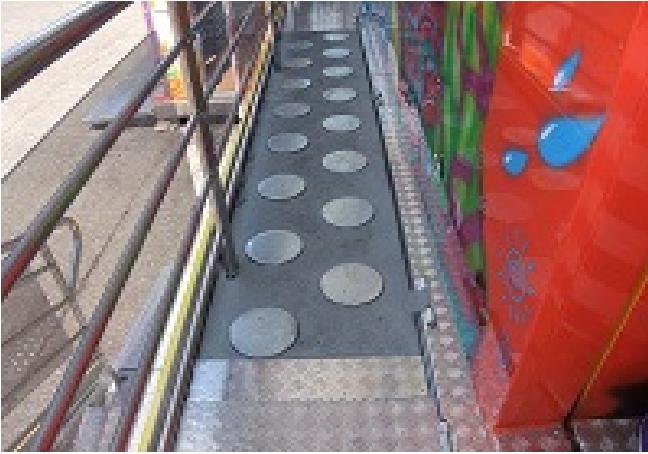
Pedana con ostacoli cilindrici L=3,5m x P=0,70m x H=0,33m