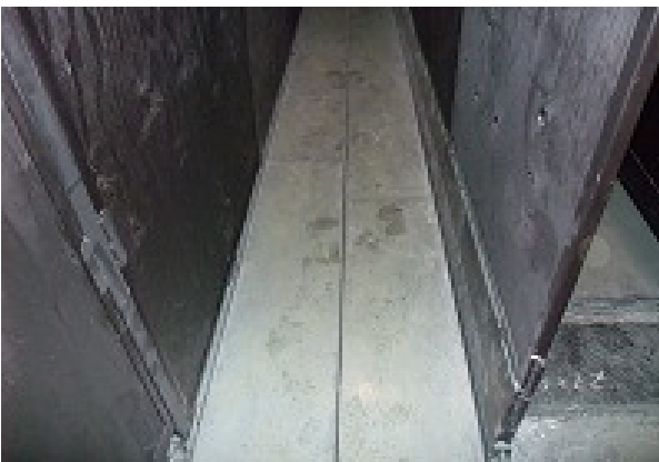
Pedana Avanti indietro L=3,00m x P=0,70m x H=0,45m